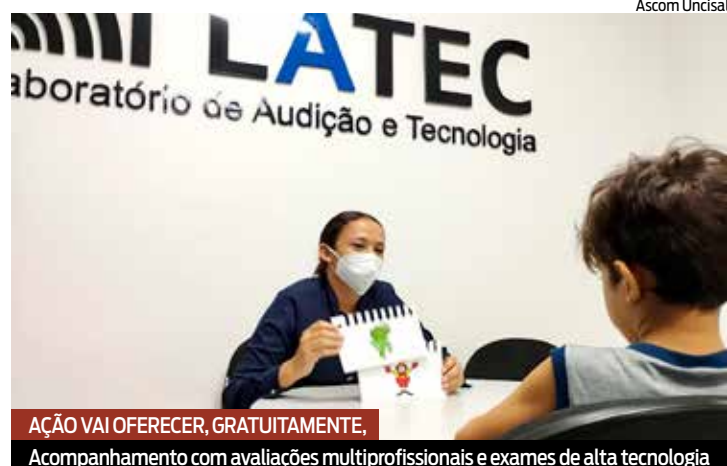
AÇÃO VAI OFERECER, GRATUITAMENTE, Acompanhamento com avaliações multiprofissionais e exames de alta tecnologia

A ação oferece, gratuitamente, um acompanhamento das crianças com avaliações multiprofissionais e exames de tecnologia avançada. As crianças passarão por avaliação auditiva completa, avaliação cognitiva e avaliação do desenvolvimento da linguagem. Os