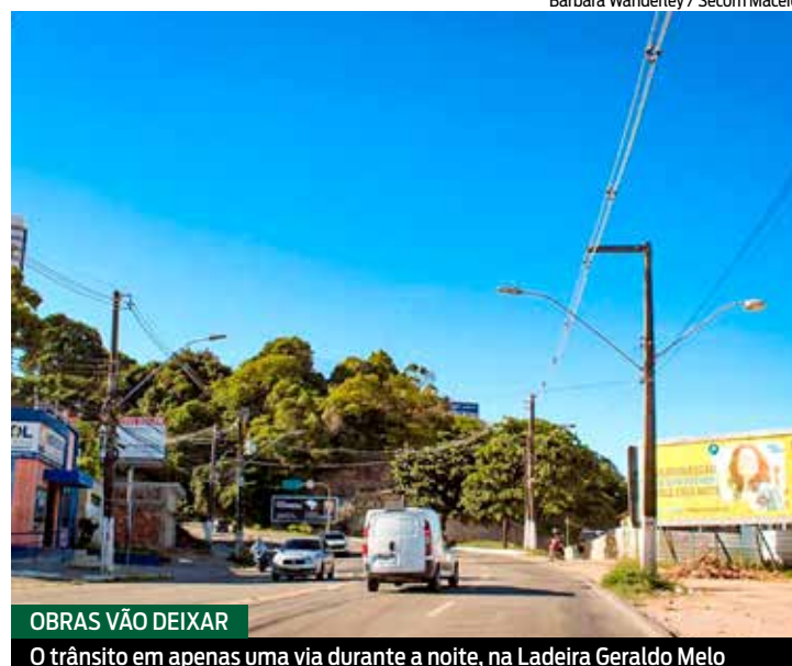
OBRAS VÃO DEIXAR