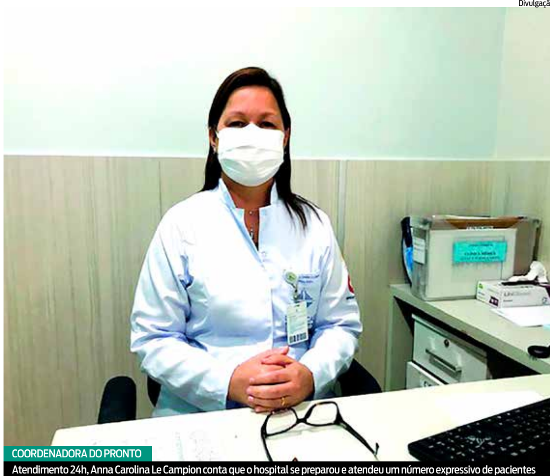
COORDENADORA DO PRONTO

Neste momento, o hospital registra a diminuição contínua do número de pacientes com síndromes gripais que chegam ao Pronto Atendimento 24h. O atendimento desses casos caiu de 70% (janeiro) para