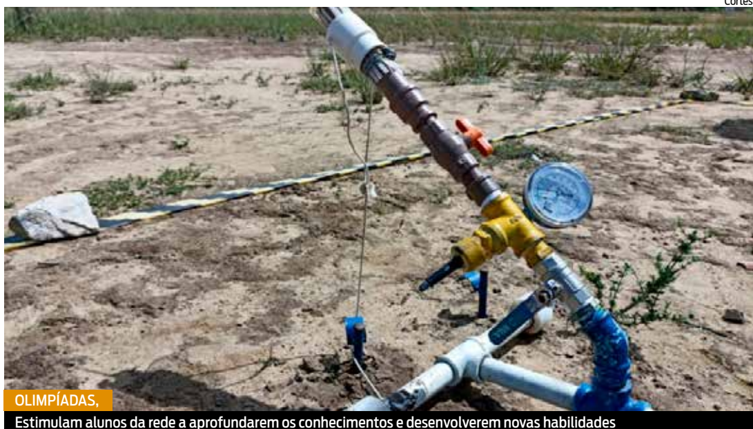
OLIMPIADAS, Estimulam alunos da rede a aprofundarem os conhecimentos e desenvolverem novas habilidades