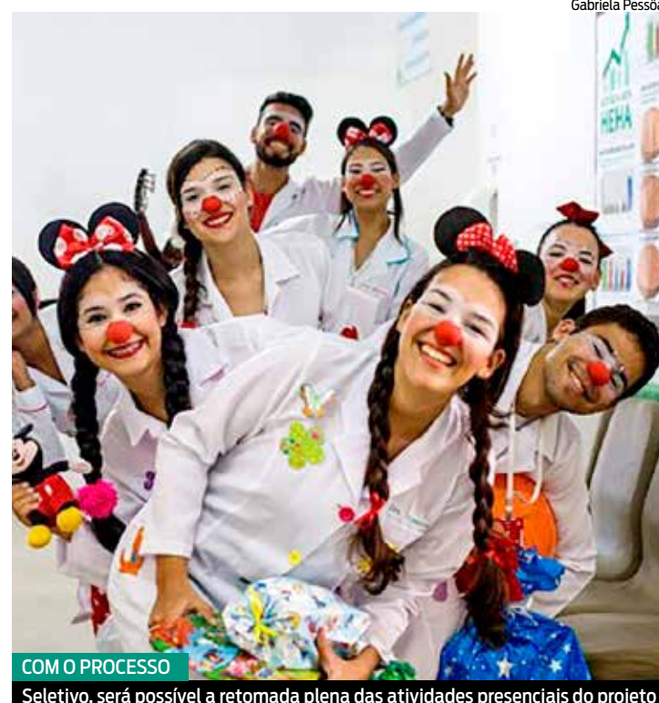
COM O PROCESSO

Para se inscrever, o candidato ou candidata deverá acessar o site www.sorrisodeplantao.com.br . No endereço eletrônico, também está disponível o edital contendo todas as informações. Para fazer a inscrição é necessário, entretanto, está com o cartão vacinal atualizado.