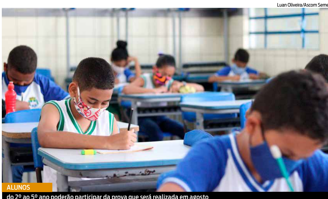
ALUNOS do 2º ao 5º ano poderão participar da prova que será realizada em agosto

A inscrição é realizada pela gestão da própria escola. Os responsáveis precisam ler com atenção o regulamento, e ficarem atentos às datas do calendário, pois não há previsão de prorrogação. A Escola Municipal Pompeu Sarmiento, do Barro Duro, já se inscreveu com 8 turmas e 340 alunos. A unidade escolar é destaque quando se trata de olimpíadas. Em 2021, os estudantes