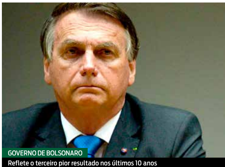
GOVERNO DE BOLSONARO

"O Brasil está passando por uma rápida deterioração do ambiente democrático e desmanche sem precedentes de sua capacidade de enfrentamento da corrupção. São marcos legais e institucionais que o país levou décadas para construir. Isso traz consequências