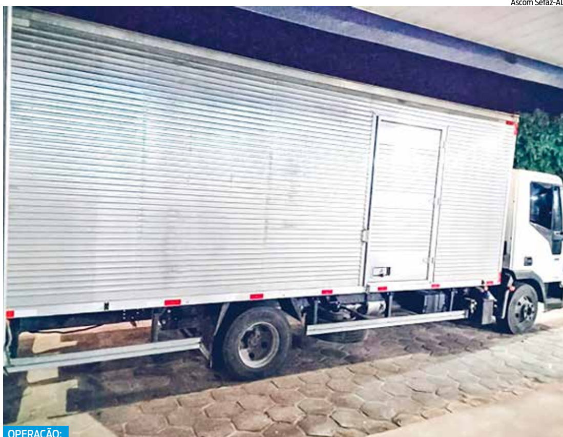
OPERAÇÃO: Sefaz e PRF fiscalizaram caminhões e detectaram que muitos apresentaram diversas mercadorias sem documentação fiscal

O objetivo da operação visa coibir o prejuízo que a sonegação causa aos contribuintes regulares. As empresas que apresentam inconsistências recebem e assinam os termos e as mercadorias são liberadas após o pagamento da multa. As retenções são feitas apenas daqueles que efetivamente estão irregulares com suas obrigações de recolhimento de tributos. Porém, a maioria das retenções é devido às irregularidades da ausência de Nota Fiscal ou de documento fiscal.