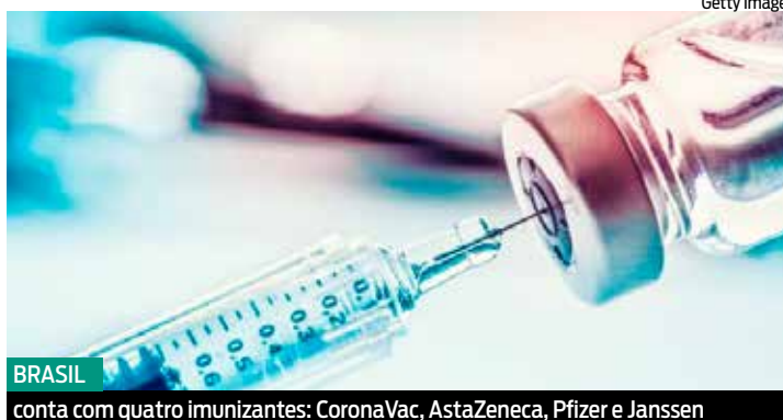
BRASIL conta com quatro imunizantes: CoronaVac, AstaZeneca, Pfizer e Janssen

• Mais de 14 mil registros de vacinação com data de aplicação anterior ao dia 17 de janeiro de 2021, dia em que a campanha de imunização