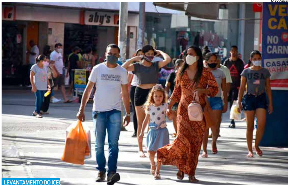
LEVANTAMENTO DO ICEC registrou um cenário de estabilidade com expectativa pela retomada econômica; pesquisa foi antes dos últimos surtos de Covid

Ainda de acordo com o levantamento, que é elaborado pelo Instituto Fecomércio Alagoas, em parceria com a Confederação Nacional do Comércio de Bens, Serviços e Turismo (CNC), em maio, o índice chegou a ficar abaixo dos 100 pontos. Contudo,